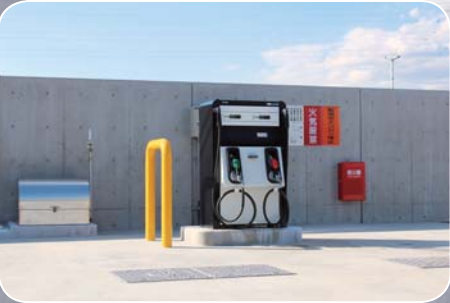
自家用給油取扱所