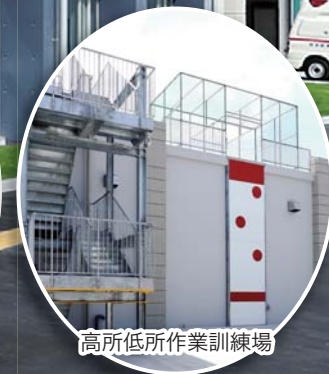
高所低所作業訓練場