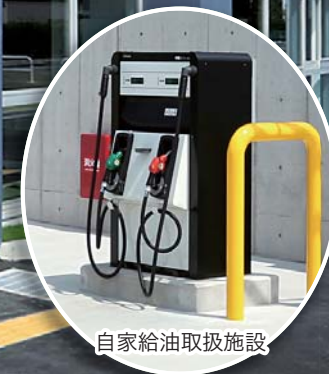
自家給油取扱施設

我々、消防職員として、地域住民の皆様の生命、身体、財産を災害から守ることは消防の根本であり、いかなる時でも皆様の期待に応えるため、消防の組織作りに全力で力を注いでまいります。