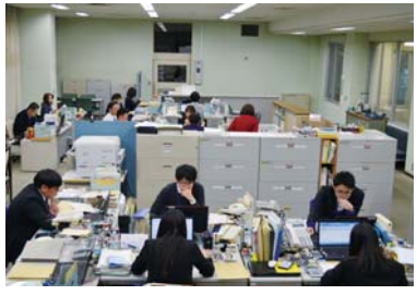
山武郡市振興センター事務室

公金を適正に管理するために、組合の収入及び支出に関する仕事をしています。支出に関する証拠書類等の確認や審査、公金の支払いや手数料等の収納、決算の調整事務などを行っています。