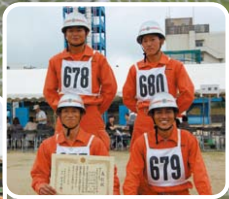
ロープブリッジ救出訓練1位